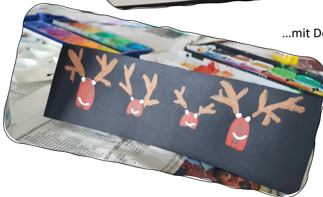
...mit Deinen Fingern