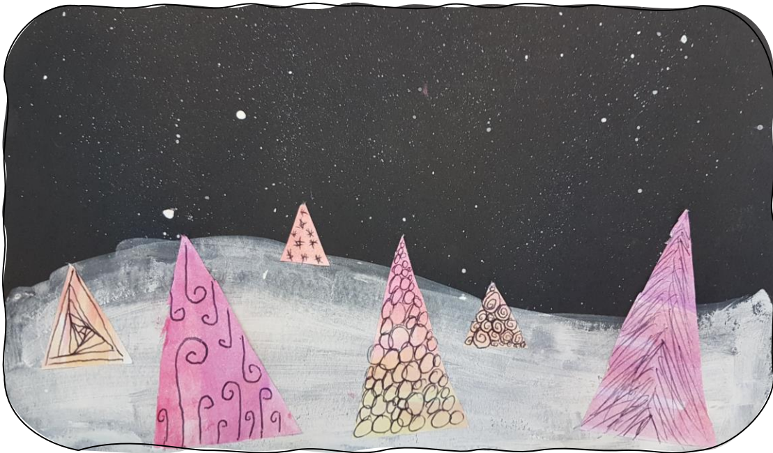
Tannenbäume aus bunten Papier-Dreiecken

Weißes Papier bunt mit Wasserfarben bemalen . Trocknen lassen. Ausschneiden.... kleben. Für den Sternenhimmel: Etwas Deckweiß mit Wasser vermischen und den Hintergrund mit einer alter Zahnbürste oder Borstenpinsel bespritzen.