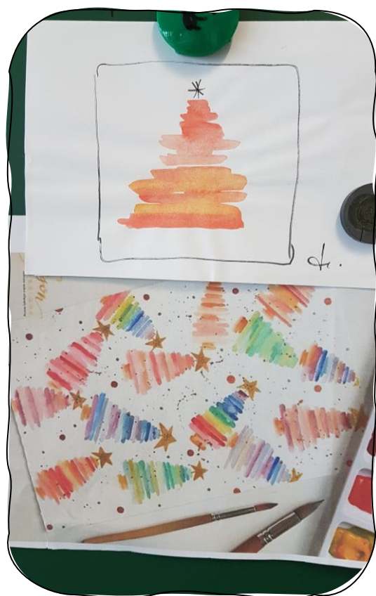
...mit einfachen Pinselstrichen.