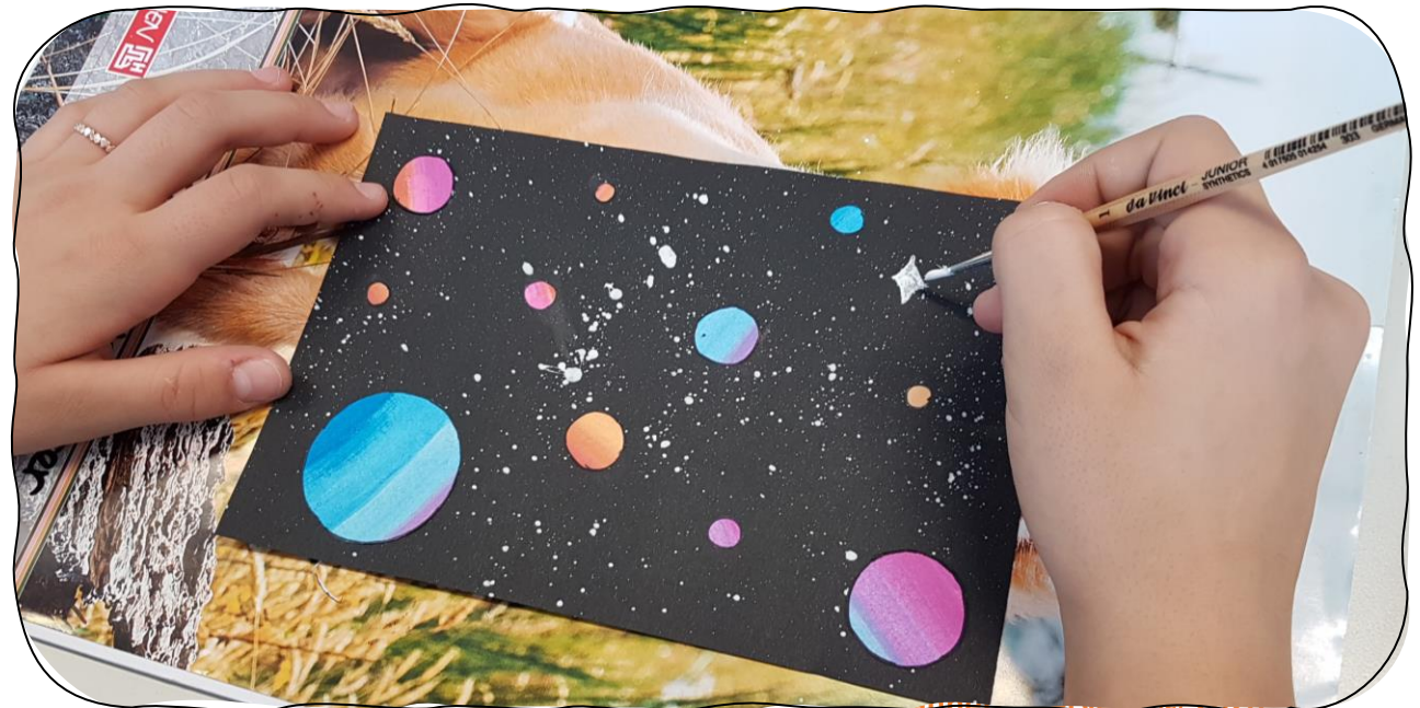
Planeten-Himmel aus bunten Papier-Kreisen

Weißes Papier bunt mit Wasserfarben bemalen . Trocknen lassen. Ausschneiden.... kleben. Für den Sternenhimmel: Etwas Deckweiß mit Wasser vermischen und den Hintergrund mit einer alter Zahnbürste oder Borstenpinsel bespritzen.